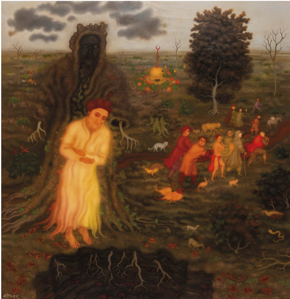
JEDERMANN MIT DEM TOD Öl auf Platte, 90 x 86 cm, WN1002, 2019

In der Festspielausstellung 2019 wird erstmals ein neuer Bilderzyklus von Arik Brauer zu dem Salzburg-spezifischen Thema „JEDERMANN von Hugo von Hofmannsthal - Das Spiel vom Sterben des reichen Mannes“ gezeigt.