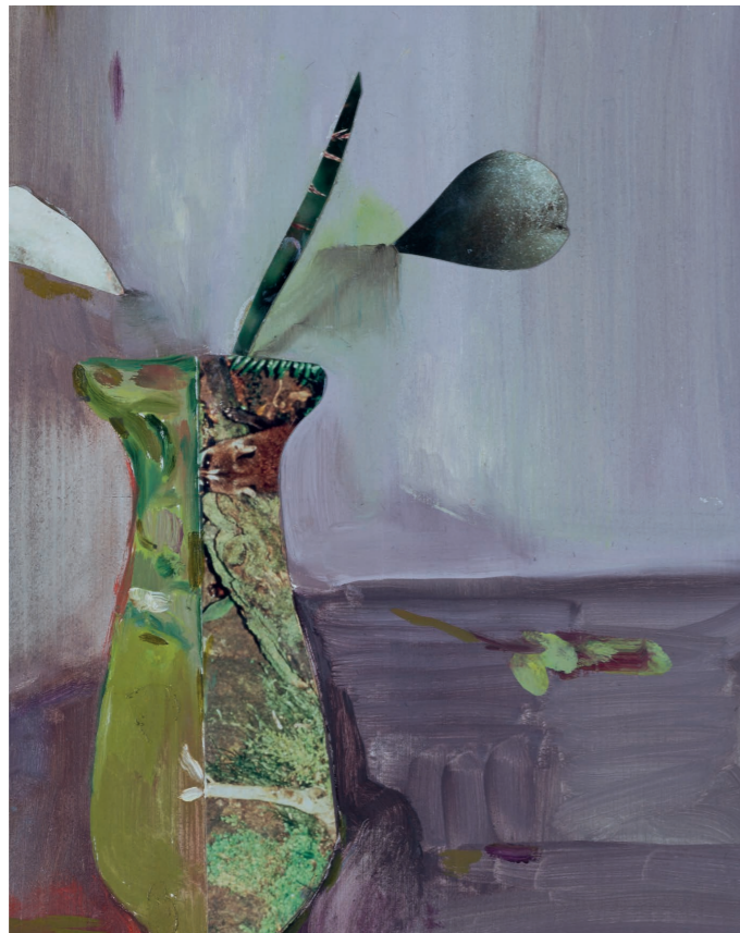
© U. Hübner Ursula Hübner, Vase 3, 2022, Collage auf Holz, 30 x 24 cm